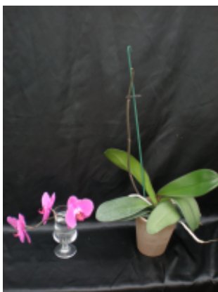
* 二度咲きの準備完成図