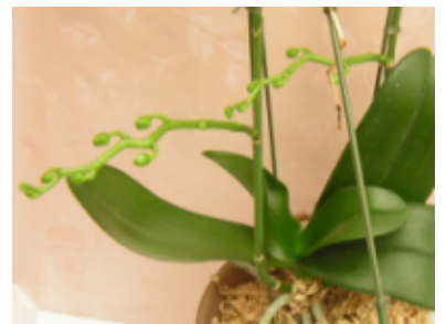
* 節から芽が出てきた状態